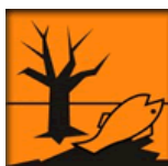
PRODUKT NIEBEZPIECZNY DLA ŚRODOWISKA